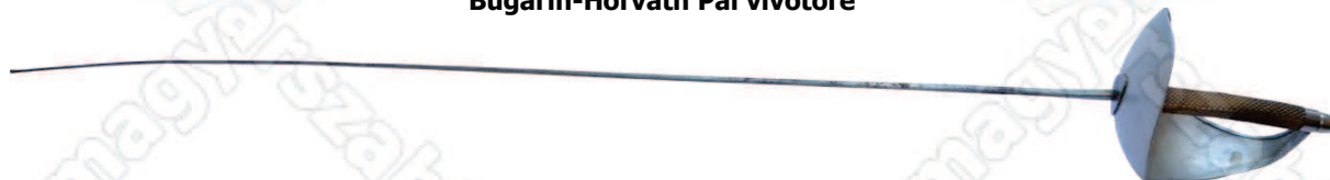
Bugarin-Horváth Pál vívókardja