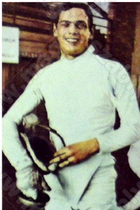
Kulcsár Győző, 1970

Tőr- és párbajtőrvívásban egyaránt versenyzett, 1962-től 1979-ig szerepelt mindkét fegyvernem magyar válogatottjában, de kiemelkedő eredményeit párbajtőrvívásban érte el. Közel két évtizeden keresztül jelentős része volt az akkoriban a világ egyik legjobb csapatának tartott magyar párbajtőrválogatott sikereiben. A magyar csapattal 1964-től három egymást követő alkalommal nyert olimpiai bajnoki címet, és 1968-ban az egyéni versenyt is megnyerte, így máig ő minden idők egyik legeredményesebb párbajtőrözője. A vívóvilágbajnokságokon kilenc érmet – köztük három aranyérmet – nyert, valamennyit a magyar csapat tagjaként. A válogatottságtól az 1980. évi olimpia előtt vonult vissza, az aktív sportolást 1980-ban fejezte be.