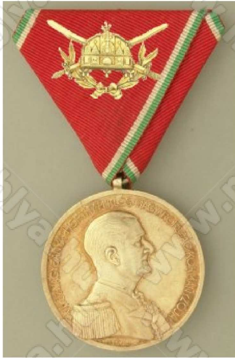
Magyar Tiszti Arany Vitézségi Érem