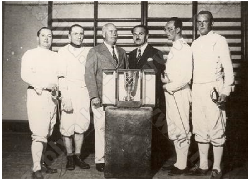
Az 1932-es "Schenker Lajos" kupán győztes KAC csapat