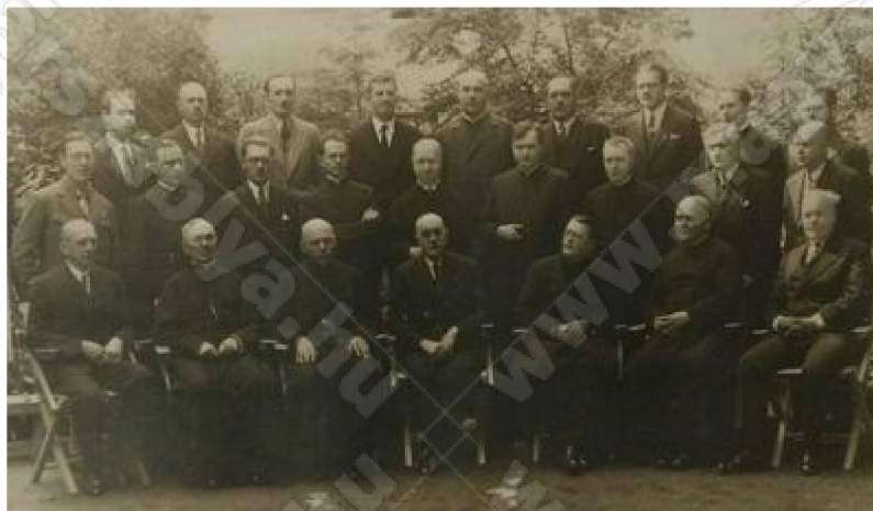
A Római Katolikus Gimnázium tanári kara a 30-as években.

Torna-oktatási módszere a serkentő, dinamikus, produktív, nagy fegyelemre nevelő módszer volt. Óráin az osztályt felosztotta csoportokra, és ezeket az osztály legjobb tornászai irányították az ő ellenőrzése alatt. A tornaóra mindig énekes felvonulással kezdődött. Az akkori kolozsvári tornatanárok közül sokan látogatták óráit tapasztalatszerzés céljából.