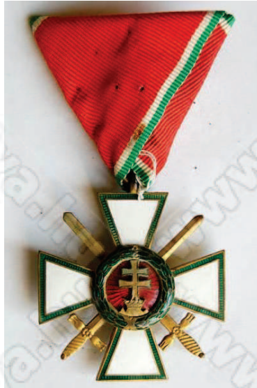
MÉR Lovagkeresztje hadiszalagon a kardokkal